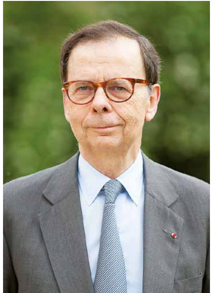
Louis Schweitzer, Président Initiative France.

Par plusieurs facteurs. D'abord, les projets soutenus sont plus solides. Ils ont été validés par un comité d'agrément, après que leur montage a été accompagné ou validé par la plateforme. Et quand un projet est imparfait, nous invitons son porteur à l'améliorer. Second facteur : nous faisons en sorte que les entreprises que nous aidons bénéficient d'un prêt bancaire au moment de leur création. C'est essentiel : trop d'entreprises, parfaitement viables, meurent à cause d'un problème de trésorerie qui n'a pas été anticipé. Enfin, troisième facteur : l'accompagnement après la création : par les permanents de la plateforme et, de plus en plus, par le parrainage.