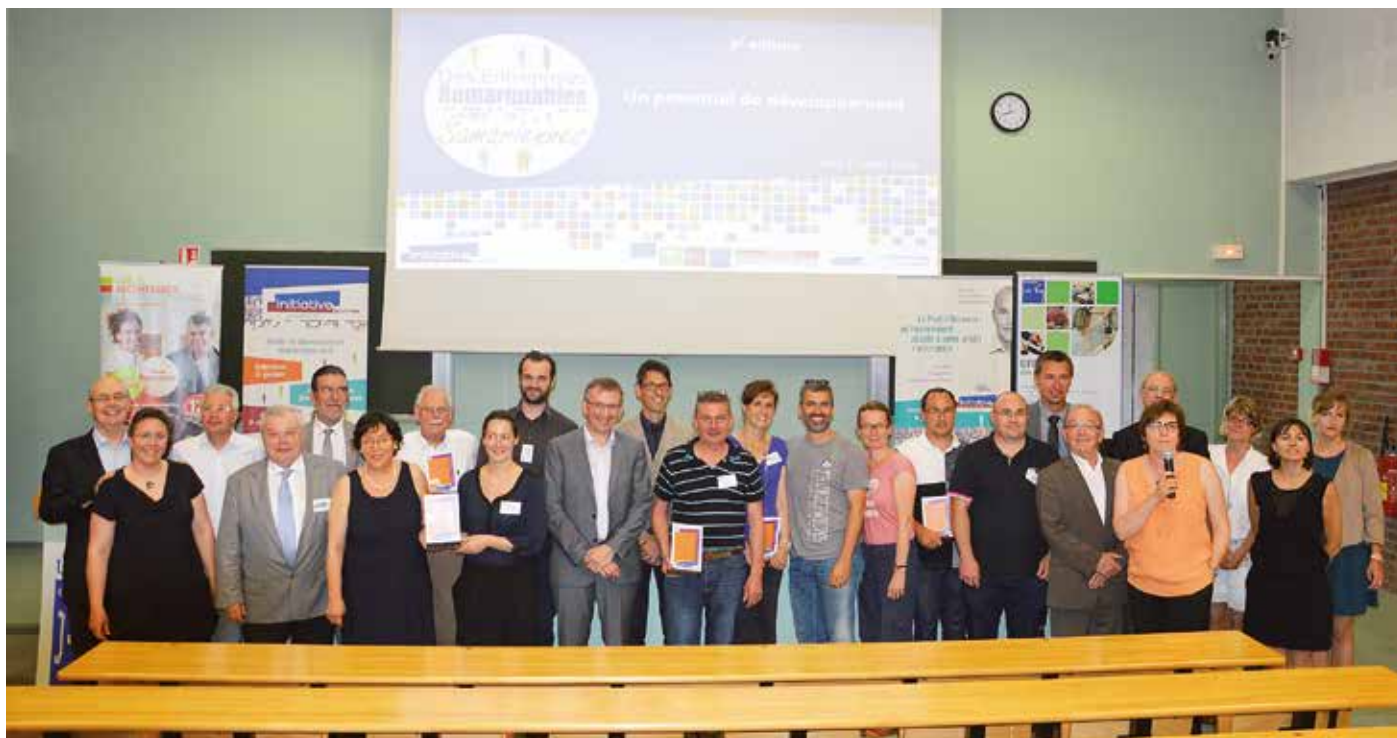
Un rendez-vous Initiative, la mise à l'honneur des entrepreneurs remarquables à Amiens en juillet 2015.